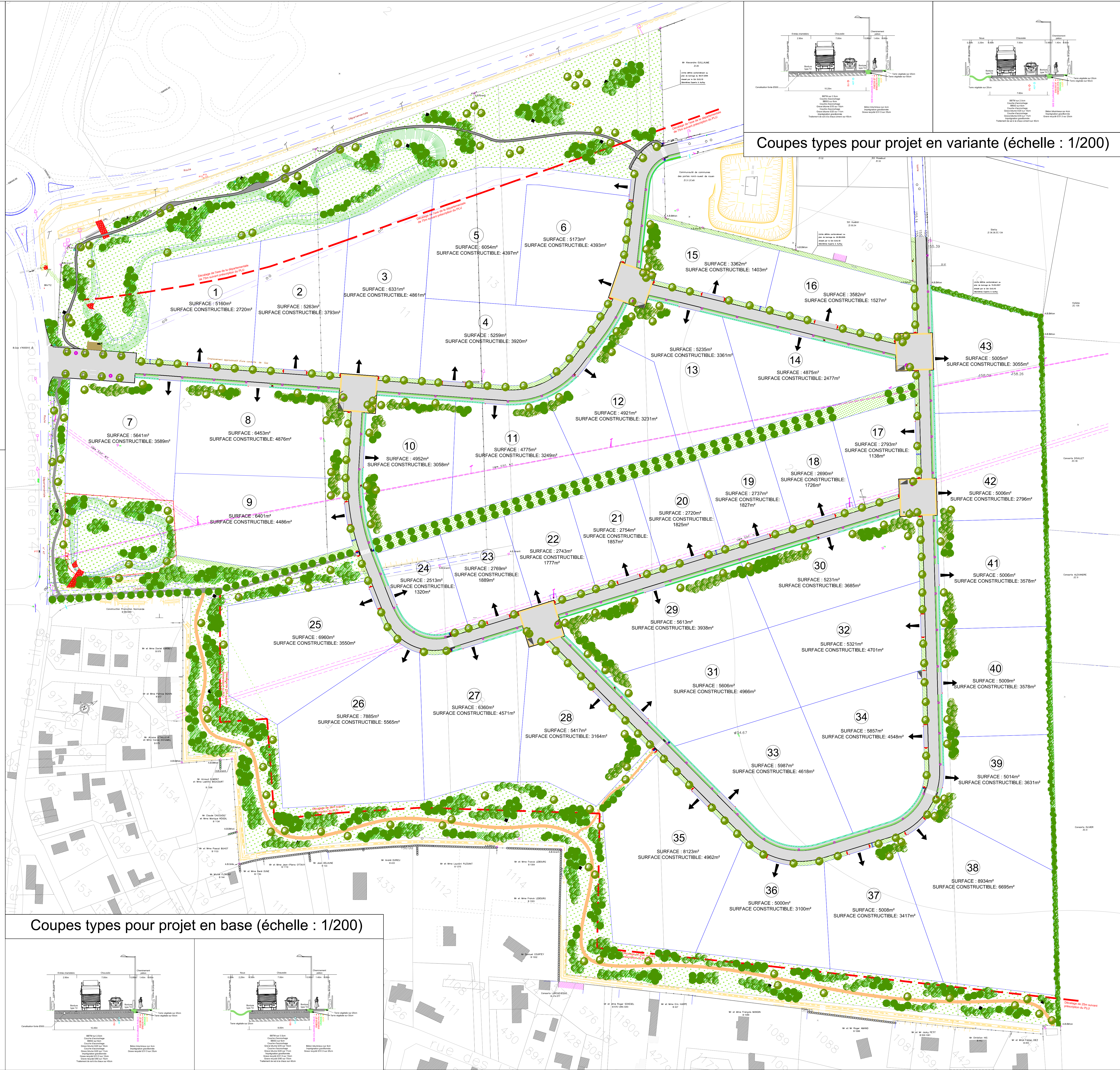
Coupes types pour projet en variante (échelle : 1/200)